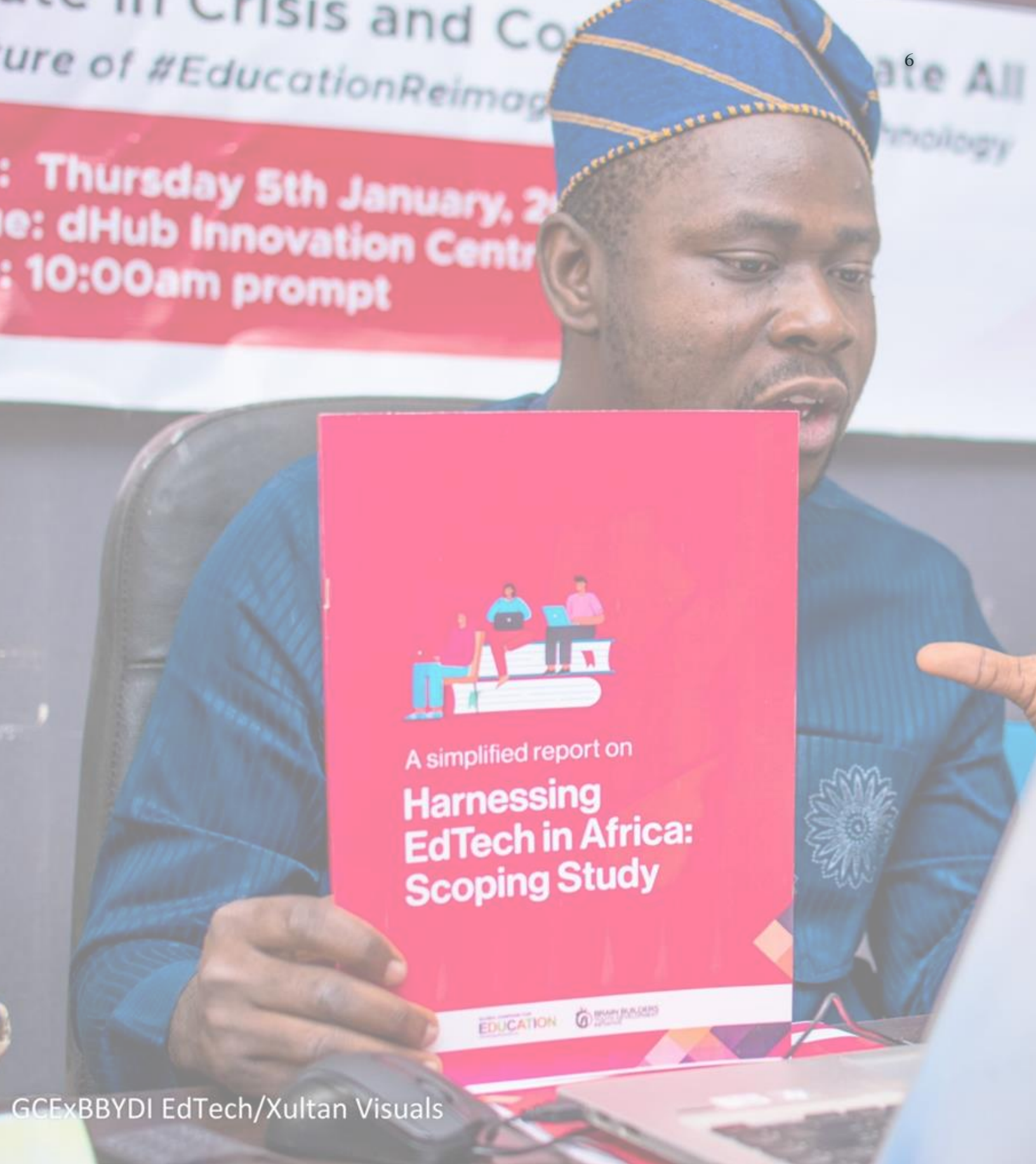
GCExBBYDI EdTech/Xultan Visuals