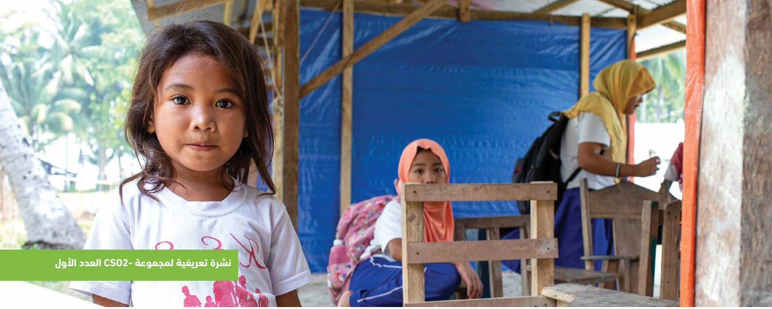
نشرة تعريفية لمجموعة CS02- العدد الأول