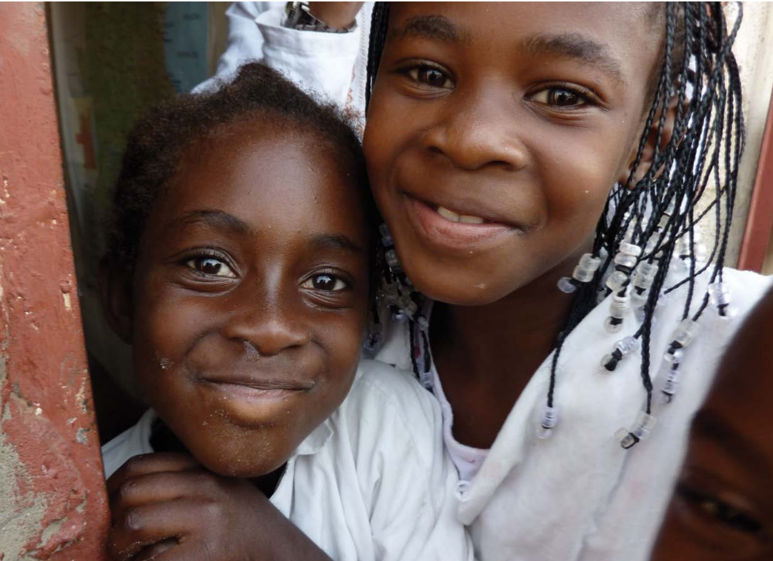
أطفال المدارس الابتدائية، لواندا، حقوق الطبع كجيرستي مو/ الحملة العالمية للتعليم

يستهدف هذا الدليل ذا فائدة تحالفات المناصرة للمجتمع المدني والحركات المدنية في جميع أنحاء العالم النامي التي تحاول جعل الحق في التعليم حقيقة واقعة في بلدانها. فالكثير من النقاش يدور حول عمليات التخطيط والهياكل التي أقرتها الشراكة العالمية للتعليم وغيرها من الجهات المانحة، وبالتالي فمن المحتمل أن يكون الدليل ذا أهمية أكبر في البلدان التي تمولها الشراكة العالمية للتعليم والجهات المانحة التي تقدم تمويلاً كبيراً للتعليم، كما يعد ذا أهمية للتحالفات التي