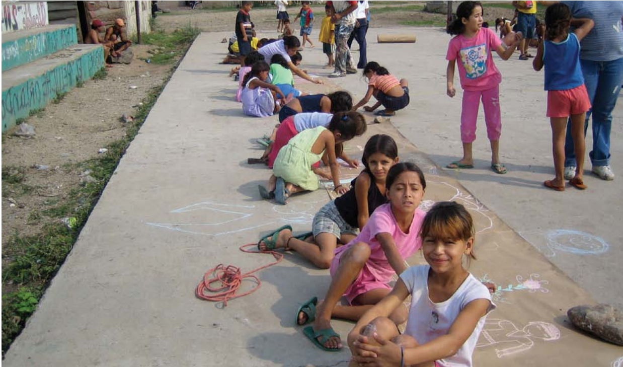
ورشة عمل مع أطفال المدارس في إستيلي.