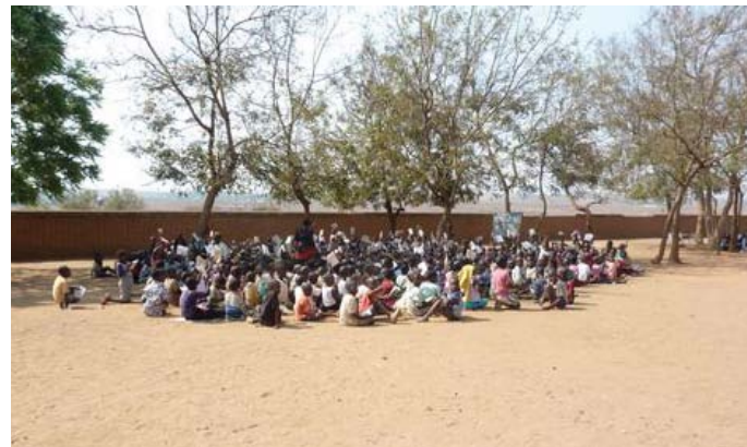
مدرسة ابتدائية في ليلونغوي، حيث يتم تدريس فصل بأكمله يضم 100 طفل تحت شجرة.

انضم التحالف الفيتنامي للتعليم للجميع (VCEFA) لمجموعة التعليم المحلي في عام 2012 وتدعى في فيتنام، مجموعة قطاع التعليم (ESG) والتي تقوم بالتنسيق مع اليونسكو كهيئة التنسيق. ومنذ إنشائها عام 2010 قام التحالف بأنشطة المناصرة لتحسين السياسات المتعلقة برعاية وتعليم الطفولة المبكرة ECE والتعليم النوعي للفئات من ذوي الاحتياجات الخاصة والتعليم المستمر. وساعد هذا الأمر على منح التحالف موقعا متميزا لدى وزارة التعليم والجهات المعنية الأخرى. ومع ذلك، ظل الوصول إلى مساحات الحوار الرسمي يمثل تحديا. وخلال شهر يونيو/حزيران 2012 بدأ التحالف بحوار مع اليونسكو حول إشراك مجموعة التعليم المحلية منافحا عن أهمية مشاركة المجتمع المدني في مثل هذه المحافل الهامة، وكانت استجابة اليونسكو بتقديم دعوة رسمية للتحالف ليصبح عضوا في مجموعة قطاع التعليم، مما فتح بابا جديدا من خلال مجموعة التعليم المحلية كوكالة تنسيق.