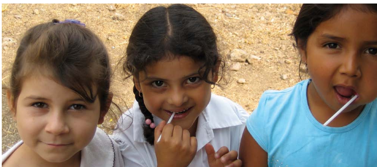
School children in rural Nicaragua