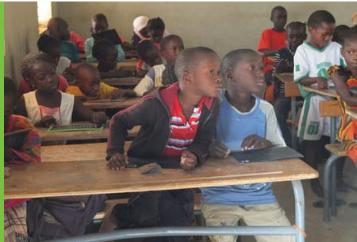
تلاميذ في فريتاون، سيراليون.

خلال السنوات الأخيرة خضعت الشراكة العالمية للتعليم/GPE لعملية إصلاح... ساعدت في التشجيع على التخطيط والتنفيذ الفعال للأنشطة، من جميع مصادر التمويل وتشمل عموم القطاع.