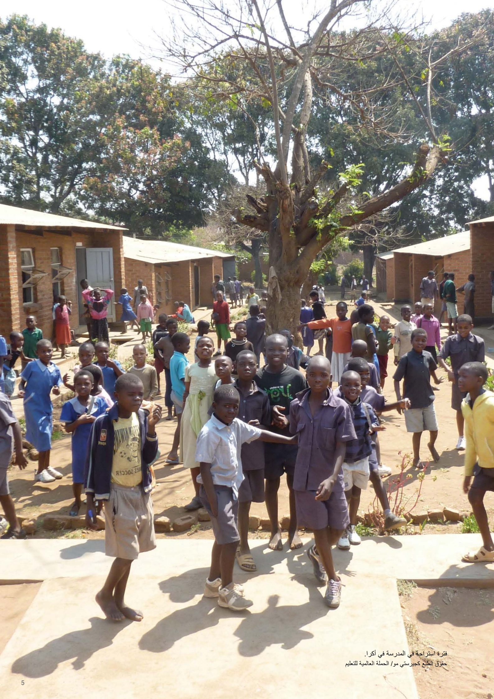
فترة استراحة في المدرسة في أكرا.