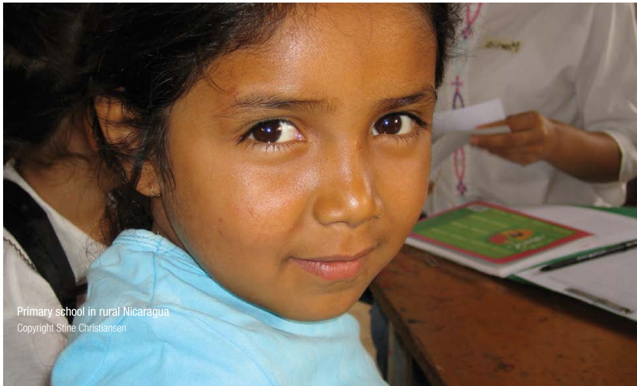
Primary school in rural Nicaragua

إذا لم تكن بعض من هذه المهارات أو المنهجيات موجودة في تحالفك الآن، فقد ترغب بالتفكير في تعزيز آليات التشاور ضمن مجتمعك، وإطلاق مشاريع للرصد، أو بناء مهارات بحثية، وستركز وثائق التعلم الأخرى للحملة العالمية للتعليم على هذه التقنيات.