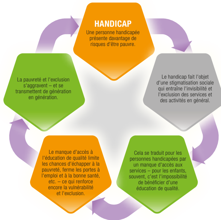
Figure 2. Cycles de pauvreté et d'exclusion

probabilité est plus élevée qu'elles soient « sous-employées », ce qui sous-entend une rémunération moindre, un travail à temps partiel, peu de perspectives à long terme. 36